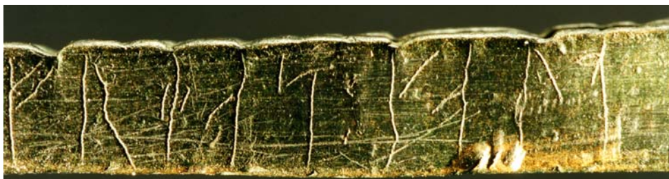
G 357. Runinskrift A.

Till läsningen: 1 f och 2 r är säkra. I runa 3 är huvudstaven säker; på båda sidor om finns två korta svagt böjda streck som möjligen var ämnade att bilda en ring på huvudstavens mitt, därför läses runan med någon tvekan som e . 4 a är säker; strax nedanför bistaven finns ett kort streck som inte bedöms höra till runan. 5 s är en gotländsk s -runa.