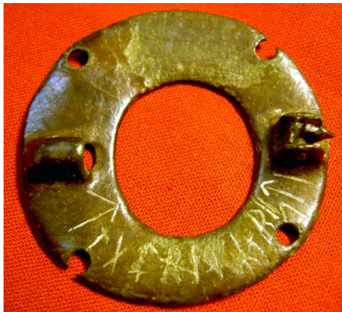
G 356. Foto: Magnus Källström 2008.

Inskriften granskades av Magnus Källström i april 2008 (Rapport till Artikelförfattaren 14 maj 2008). Han upptäckte då att delar av ristningen var målad med vit färg, vilket försvårade läsningen och att de är svårlästa framgår också av von Friesens teckning. Källström säger