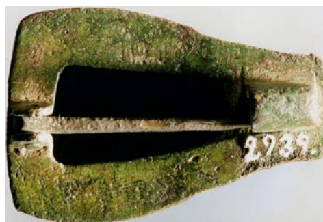
G 355. Ovansidan. Foto: Bengt A. Lundberg 1987. G 355. Bottenplattan. Foto: Bengt A. Lundberg 1987.

Till läsningen: Övre delen av 1 i är mycket diffus. Eventuellt n -bistav i runa 2. 3 k är ganska tydlig. 4 i och 5 i är mycket diffusa. 6 s är ett kortkvist- s , ca 5 mm långt, som avslutas med en punkt. Runorna 7-10 är säkra. 8 a har dubbelsidig bistav.