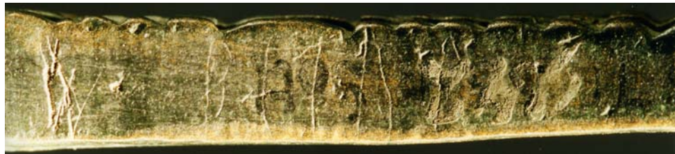
G 357. Runinskrift B. Foto: Bengt A. Lundberg 1997.

Till läsningen: I runa 1 p finns ett kort streck i den övre öglan som bedöms vara rester av en stingning. I 2 a är bistaven ytterst grund och osäker och dess anslutning till huvudstaven är helt bortnött. I runa fyra är bistaven svagt svängd och ansluter inte till huvudstaven, runan skulle möjligen också kunna läsas som r . Mellan 3 t och 4 u finns strax nedanför halv runhöjd finns två fördjupningar som troligen skall uppfattas som ett skiljetecken. Avståndet mellan 4 u och 5 l är längre än mellan övriga runor i inskriften. Därefter inga spår av runor.