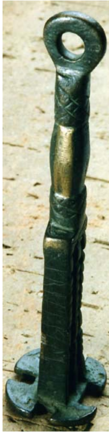
G 357. Hela föremålet. Foto: Bengt A. Lundberg 1997.