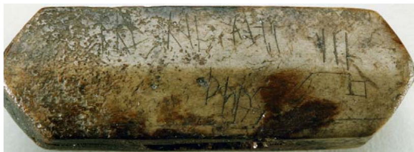
G 353. Foto: Bengt A. Lundberg 1988.

Äldre avbildningar: Teckning i Månadsbladet; foto i ATA, neg. nr. 1401:53.