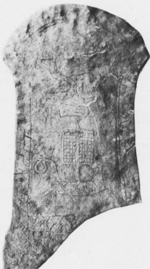
Fig. 1. Bildstenen i Lärbro.