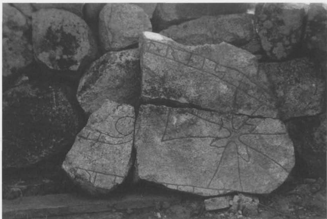
Fig. 2. De tre sammanhörande fragmenten av parstenen till U 297. – The three connected fragments of the twinstone to U 297.

och att de följaktligen har tillhört samma sten som fragmentet i tornmuren