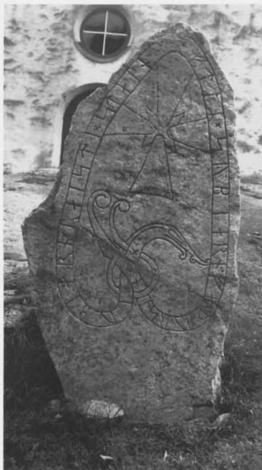
Fig. 1. Runstenen U 297 vid Skånåla kyrka, Uppland. Foto förf. – The rune-stone U 297 at Skånåla Church, Uppland.

sering av [i] till [y] framför den labiala klusilen /b/. Svante Lagman (1990, s. 80 f.) har föreslagit att runorna sy också kan återge Søy/Sø , en växelform till den vanliga förleden Sæ . Denna tolkning förutsätter dock att ristaren tecknat diftongen /øy/ med monograf, vilket möjligen motsägs av de digrafiska beteckningarna för /æi/ i orden raisti raisti och staina stæina .