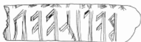
A: balikaar? —

De flerstregede, velbevarede runer, som vender toppene op mod hinanden, læses fra højre mod venstre. På B-siden følger brudkanten foroven øjensynlig en bistav, af snarest en f -rune. Det er usikkert, men sandsynligt, at indskriften begynder på den side, jeg har kaldt A, og slutter med den lidt "klemte" sidste R -rune på B-siden.