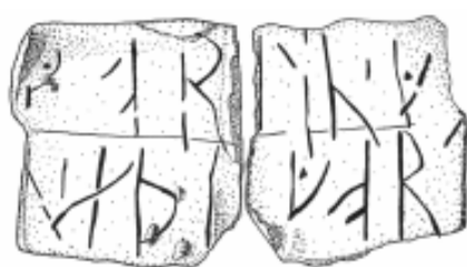
gorlin·g / n·æþigort

Dette lille sammenfoldede blystykke – et detektorfund fra Munkegård, Povlsker Sogn på Bornholm – måler 1,8 \times 1,8 \times 0,3 cm (Bornholms Museum 1228x121; Nationalmuseet D 91/2002). Det er brækket ved at blive åbnet, udfoldet er det ca. 3,5 cm langt og ca. 1 mm tykt. Det synes kun at have være foldet en gang midt over. På indersiden er der to linjer med ca. 8 mm høje runer og en lille lodret streg som skilletegn.