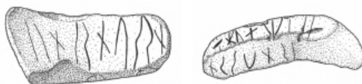
Tegning: Lisbeth Imer.

Det lille blystykke (Roskilde Museum 1684, Nationalmuseet D 120/2002) – et detektorfund – er fra Veddelevgård, Himmelev Sogn, tæt ved Roskilde; det er ca. 3 cm langt, 8–15 mm bredt, 2–5 mm tykt. Runerne findes på den ene af de to brede sider og på den tykkeste af kantfladerne. Begge indskrifterne er ca. 2,6 cm lange og næppe fragmenter af en længere indskrift. På den brede side er runerne 13–7 mm høje, idet blystykket er smallere mod slutningen af indskriften. Runerne på kantsiden er kun 3–4 mm høje. Der er ingen runer på den anden bredside, et tydeligt – og et svagt – a -rune-lignende tegn i den smalle ende har en helt anden karakter end runerne.