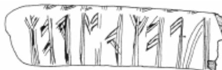
B: — fularþewar