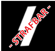
Deutsches Jungvolk (DJ) in der Hitlerjugend (HJ)

Strafbar sind hingegen auch die Kennzeichen von NS-Organisationsstrukturen, die kein Hakenkreuz aufweisen 17 :