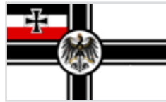
1903 bis 1921