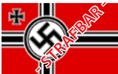
1935 bis 1937