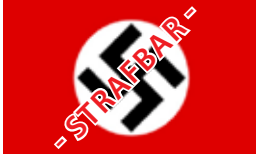
National- und Handelsflagge 1933 bis 1945 (bis 1935 neben der schwarz-weiß-roten Flagge des Kaiserreichs)

Die Hakenkreuzflagge wurde von Adolf Hitler entworfen und war ab 1920 zunächst Parteifahne der NSDAP (s.o.). Ab 1933 zunächst noch neben der schwarz-weiß-roten Flagge des Kaiserreichs verwendet, wurde sie gemäß dem Reichsflaggengesetz vom 15. September 1935 ab diesem Zeitpunkt als National- und Handelsflagge verwendet.