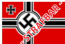
1938 bis 1945

Alle bis auf die letzten beiden sind nicht strafbar.