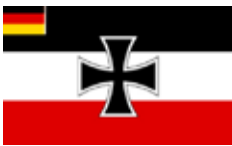
1921 bis 1933