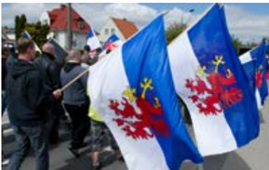
Zeigen von Flagge Pommern nicht strafbar 69

Bei öffentlichen Kundgebungen und Demonstrationen verwenden Rechtsextremisten oftmals die Flaggen von Mecklenburg und Pommern, um ihr nationalistisches Gedankengut zu verdeutlichen. Dabei nutzen sie gezielt die mit diesen Symbolen verbundenen Heimatgefühle der Bevölkerung für ihre Zwecke aus.