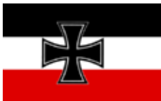
1933 bis 1935