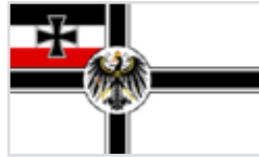
1892 bis 1903