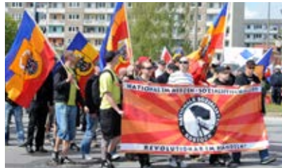
Zeigen von Flagge Mecklenburg nicht strafbar 70

Ein NPD-Landtagsabgeordneter hat in der Landtagssitzung vom 6. Dezember 2006 auf den Hinweis, dass das hiesige Bundesland „Mecklenburg-Vorpommern“ und nicht, wie von ihm kundgetan, „Mecklenburg und Pommern“ heiße, verkündet, dass er sich als Pommer und nicht als Vorpommer sehe. Allerdings gebe er der Landtagspräsidentin recht, denn schließlich würden 2/3 von Pommern „zur Zeit von Polen verwaltet“. 71