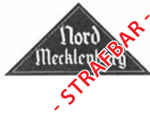
Gauleiter der Hitlerjugend