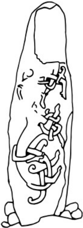
Rogstorpsstenen, Vg 14.

Det nedre djuret är bättre bevarat. Här syns ännu bättre de kopplade benen. Tyvärr vet vi inget om huvudets utformning men eftersom detta djurs övriga kroppsdelar i mångt och mycket överensstämmer med andra dåtida framställningar av "Det stora djuret" kan vi skaffa oss en viss uppfattning av djuret i sin helhet. "Det stora djuret" var en religiös och mytologisk skapelse som ofta lånade drag från olika djur, lejon, tigrar, drakar m. m.