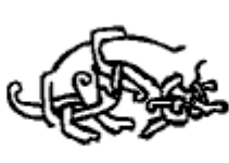
Rogstorp Vg 14