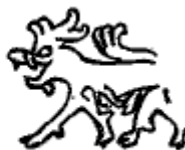
St. Ek Vg 4

Kanske har Rogstorps-stenens djurhuvud liknat något av dessa huvud.