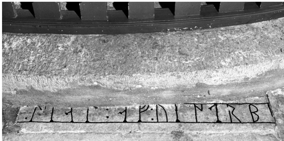
G 313. Foto: Georg Gådefors 1981.