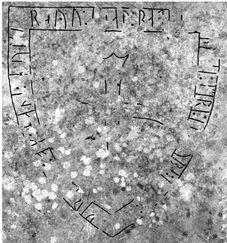
G 314. Foto: Georg Gådefors 1981.

»...för Jakobs (?) ... och hans hustrus (?) själ...»