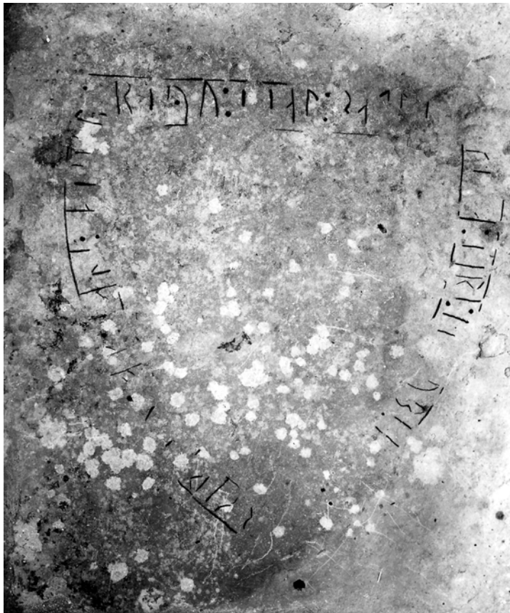
G 314. Foto: J.W. Hamner 1923.

Den sköldformade inskriften har några få motsvarigheter på de gotländska rungravhällarna och återfinns förutom på G 314 också på G 231 Vallstena kyrka och på G 290 Hellvi kyrka samt på de försvunna G 243-244 och G 246 Hejnums kyrka. Hällarna med de sköldformade inskrifterna avviker från de i det gotländska bondesamhället så karaktäristiska korsornerade runhällarna men också från de ”hanseatiska” vapensköldhällarna i Visby. Möjligen rör det sig om ett lokalt mode i Forsa och Bäls ting, influerat av sköldkonturerna på Visbyhällarna. De sköldformade inskrifterna uppträder redan under första hälften av 1300-talet och i inskrifter från samma århundrade förekommer också z -runan ( 1 ).