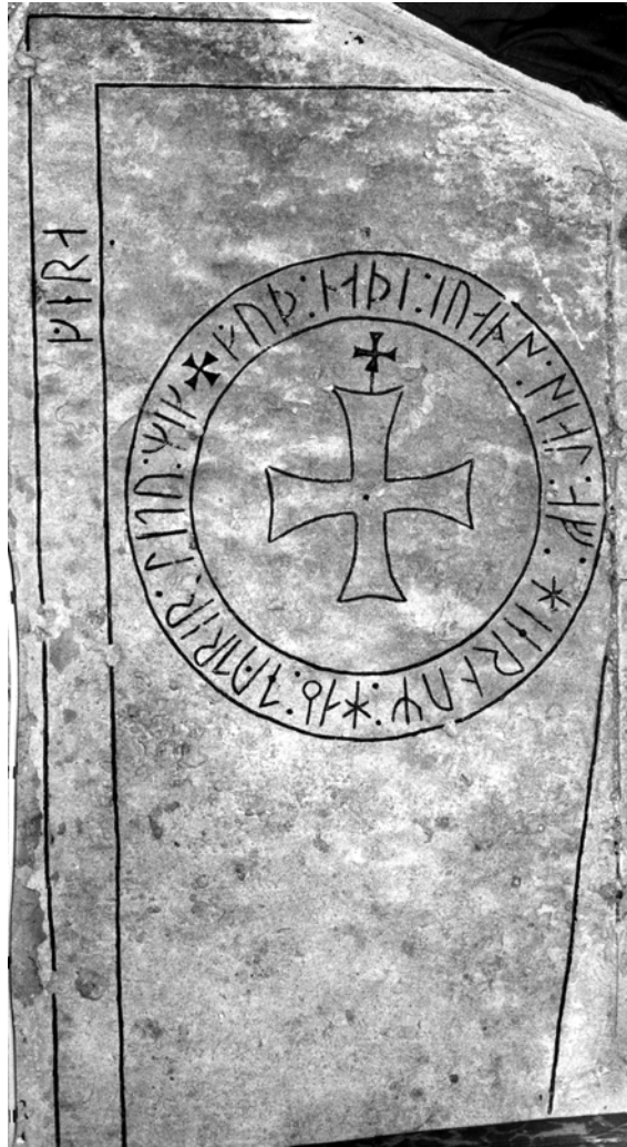
G 312.

»Gud vare nådig Johans från Hjärne (?) själ. Hans döttrar lät göra mig.»