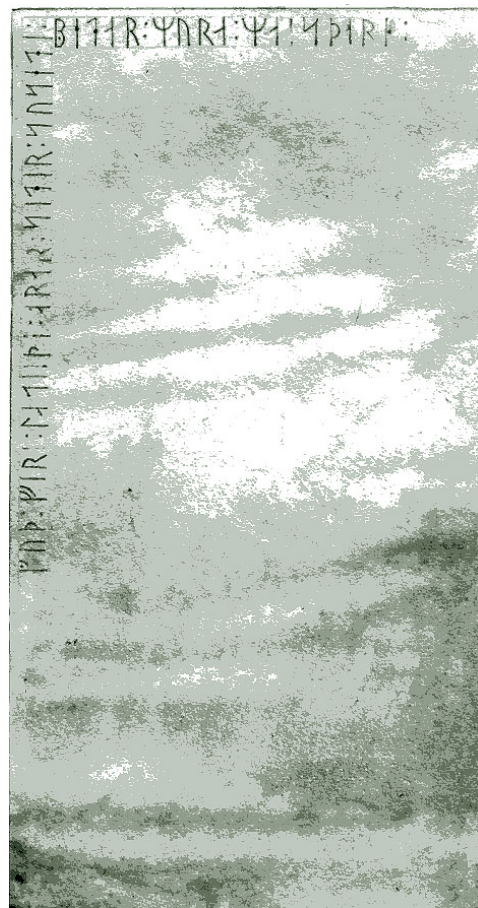
G 336. Teckning av P.A. Säve, i Atlas till Reseberättelse 1851-52, Pl 10.

C. Säve granskade stenen 1844 och 1854 och han håller fast vid sin läsning av runföljden lati us och ansluter sig inte till broderns eller Hilfelings läsningar. Den läsningen stämmer också med den i övrigt helt likalydande inskriften G 337.