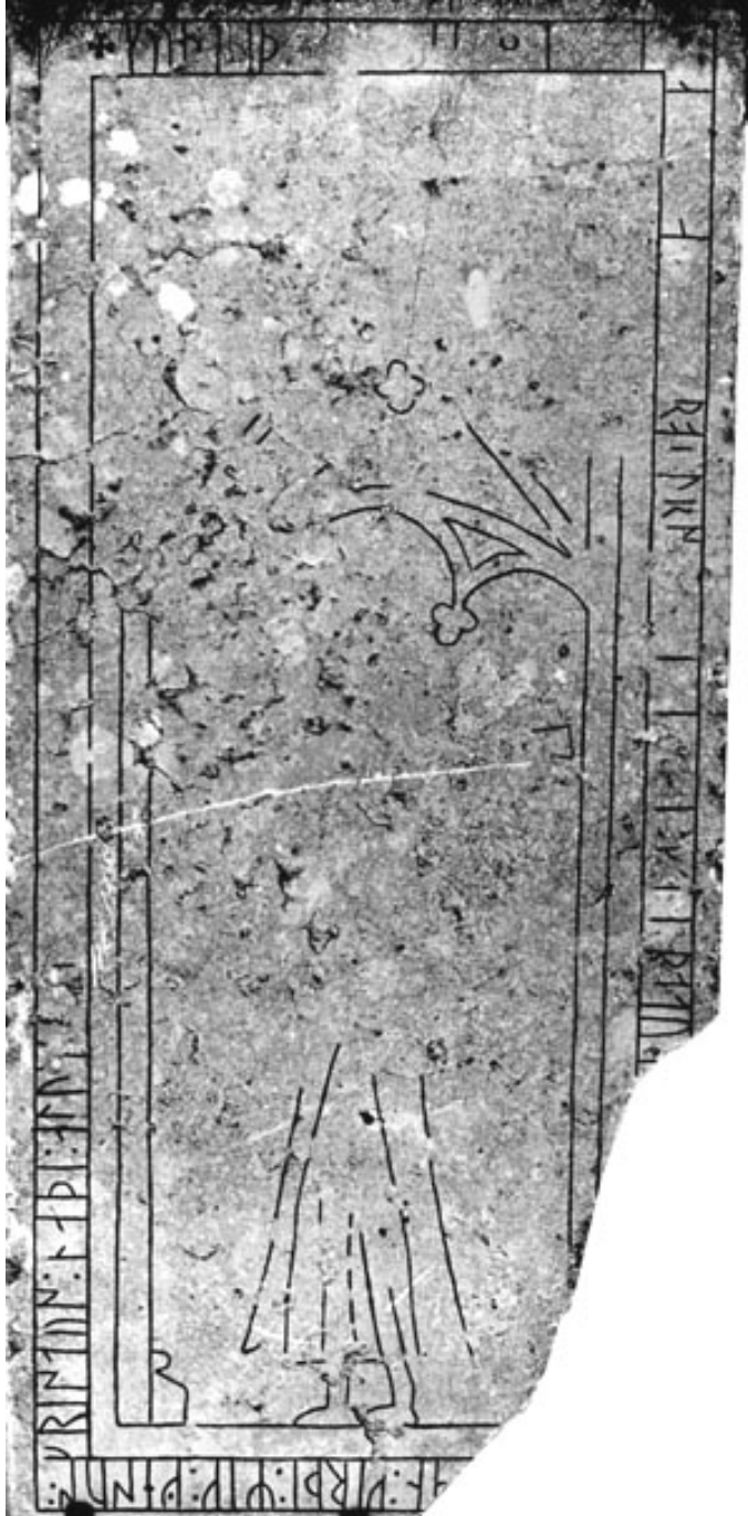
G 334. Foto: Lennart Lindquist 1983.

Till läsningen: Inskriften inleds med ett litet likarmat kors (3,5×3,5 cm). I 1 k kan följas som en mörkare skuggning i ristningsytan. Inga spår av stingning. I 2 u är ett stycke av huvudstavens övre del borta i en rund vittring; likaså bistavens nedre spets. I 3 p är basen och ett stycke av huvudstavens mitt borta i en vittring; av bistaven kan övre hälften iaktas. Av 4 n återstår en grund och diffus huvudstav, inga spår av