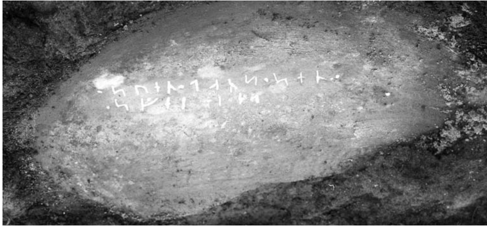
G 339. Foto: J. W. Hamner 1922.