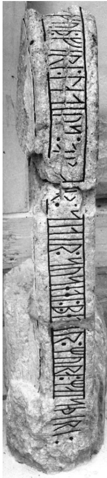
G 337.

»Gud förlåte oss våra synder, så sade Petar murarmästare.»