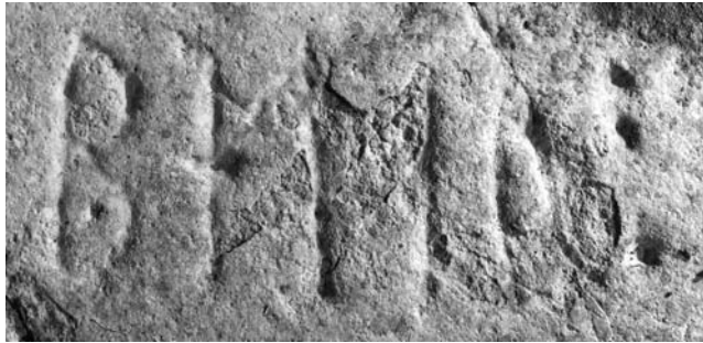
G 338.

Till läsningen Runa 1 p är stungen med en punkt i den nedre öglan; runans mitt med bistavarnas ansättning mot huvudstaven är vittrad. 2 e är stungen med ett kort vågrätt streck på huvudstavens mitt. 3 t har ensidig bistav. I 4 a är bistaven kort, grund och utvittrad. I 5 r huvudstavens bas och bistavens nedre streck mycket utvittrade. Inskriften avslutas med ett skiljetecken i form av tre punkter.