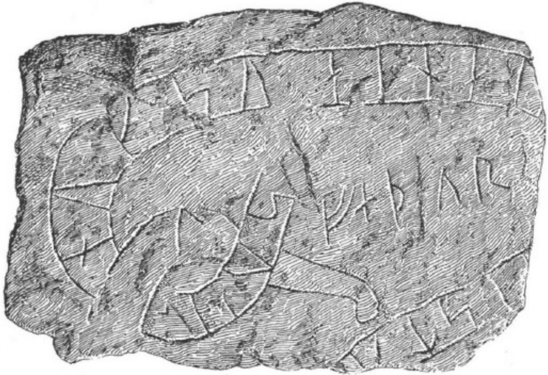
2. Ög. 100. Ringarum.