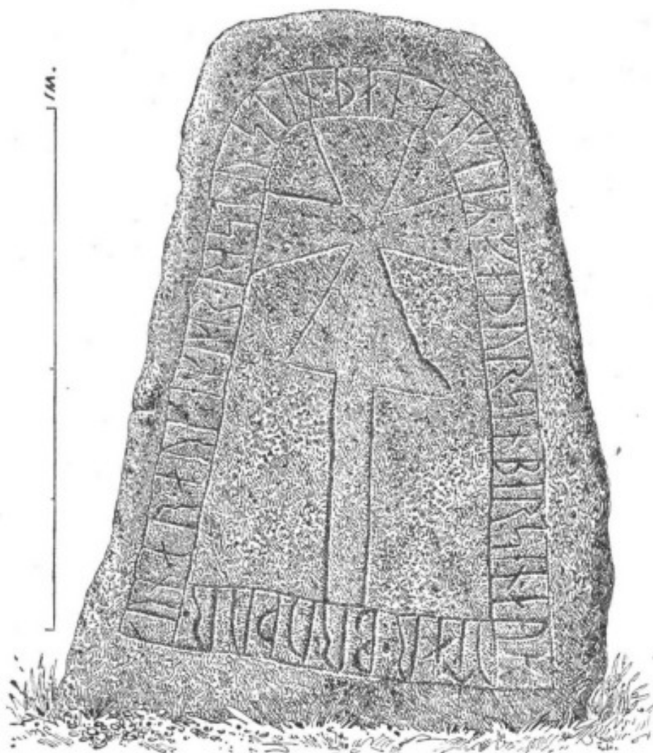
2. Ög. 118. Slaka.