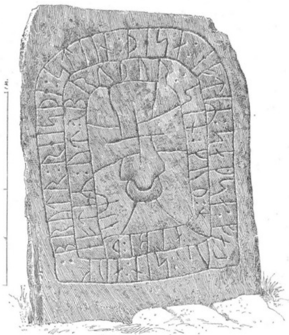
2. Ög. 133. Häggestad.