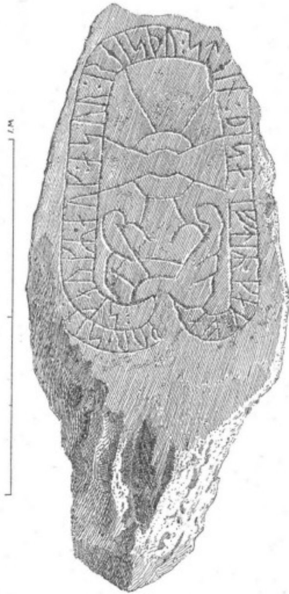
2. Ög. 135. Gärdslösa.