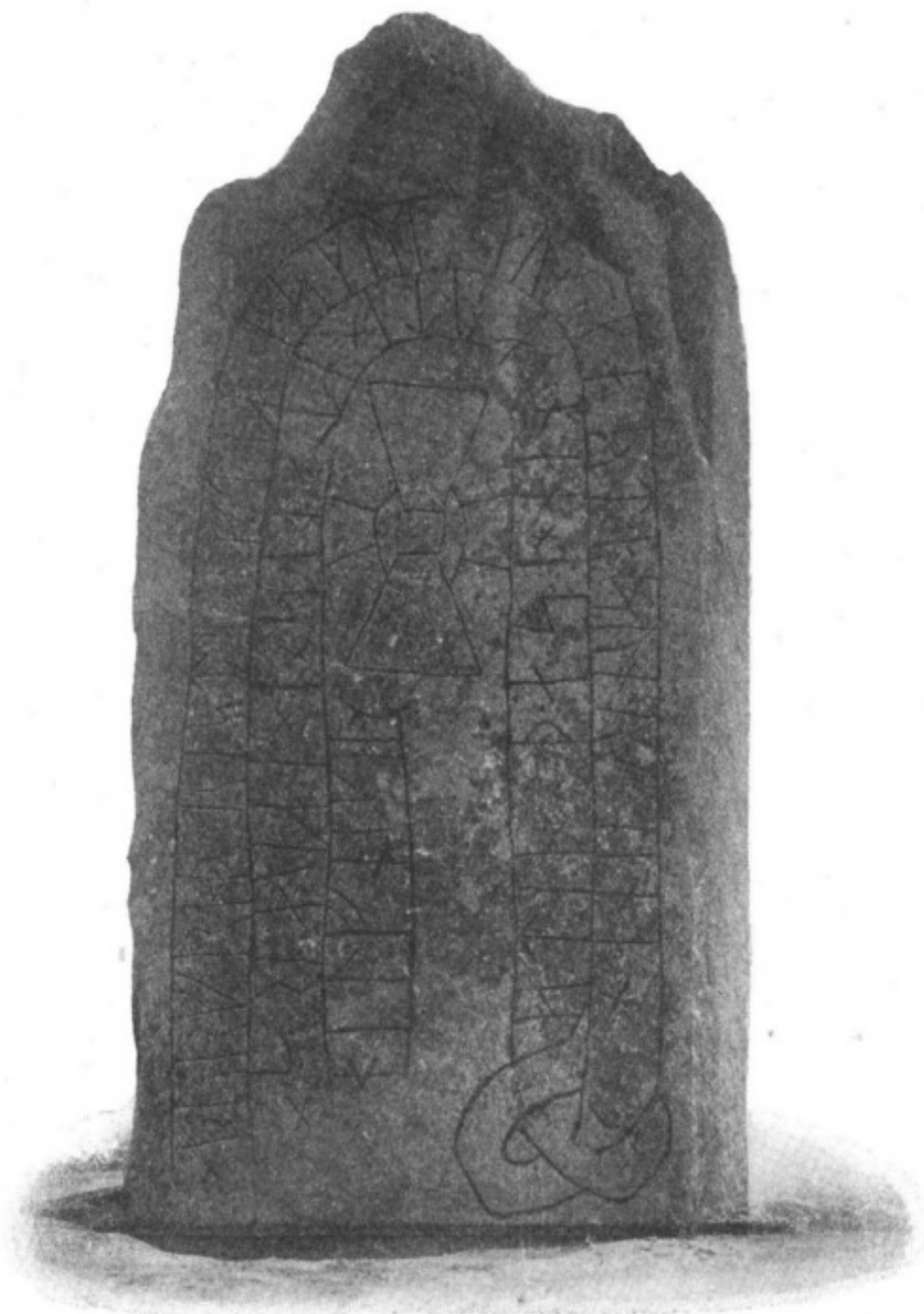
2. Ög. 155. Sylten.

Peringskiöld säger runstenen finnas »uthi en hage wid Syltan», och enligt teckningen i B. 857 stod den då rest. Broocman fann den liggande med en kant under jorden, som