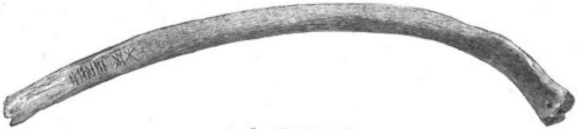
2. Ög. 173. Skärkind.