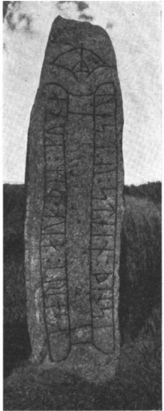
3. Ög. 201. Veta, vänstra kantsidan.