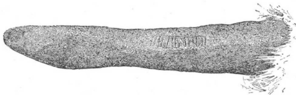
1. Ög. 38. Boborg (från kanten).

»På ett av de sydvester om Tornby helägna åkergårderna finnes bland andra minnesmärken ett kullrigt block af circa 12 fots längd och 4 à 5 f. höjd. Å dess norra yta löper från öster 3,2 fot från marken ett 7 à 6 tum bredt band och sluter i vester 5 tum från marken. Det har visserligen vid första påseende en förvillande likhet med en runristad slinga, men sannolikt är här såsom vid Runamo en lusus naturæ , ehuru en och annan figur verkl. ser ut som inhuggen.»