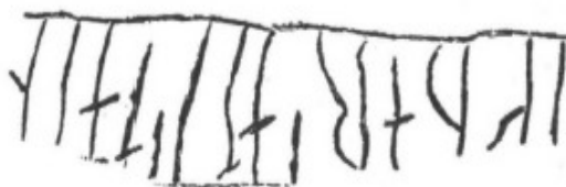
4. Ög. 38. Boberg (runformerna).