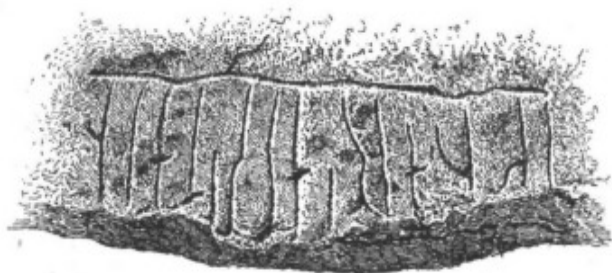
3. Ög. 38. Boberg (inskriften).

Runorna i denna inskrift visa mycken släktskap med dem i kortkvistgruppens inskrifter, och inskriften torde med fog kunna räknas till denna grupp. Avgörande är därvid formen på s , a , n , att kännestrecket på u utgår långt nedom stavens topp och att runan t utvecklats till en egendomlig form, vilket ock är fallet i andra inskrifter av gruppen, fast denna form ej i dem alla anträffas.