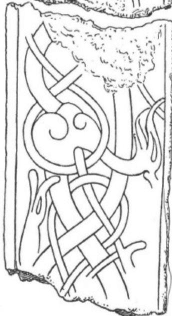
5. Ög. 80. Högby.