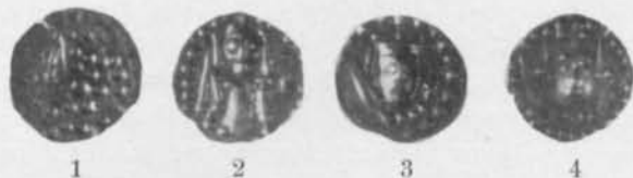
Fig. 89. Opublicerade typer och varianter av Knut Erikssons Västerås-brakteater i K. Myntkabinettet.

Även i några andra fall äro Mackmyra-fynden upplysande i fråga om sammanhangen mellan de olika typerna inom gruppen. Typ 7 (fig. 88:7) är som nämnts här företrädd med ett förstadium (fig. 88:6), som står primärtypen nära, och som visar att denna ej, som förut antagits, är identisk med typ 5 (IVA-brakteaten, fig. 88:1, enligt Appelgren) eller med typ 14 (fig. 88:5, enligt Galster) utan