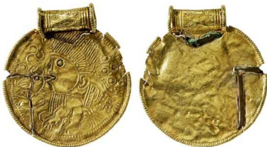
Fig. 2. Guldbrakteat fra Ericsberg-samlingen (IK 116,2), for- og bagside. Diameter 34 mm. —Gold bracteate from the Ericsberg collection, obverse and reverse.