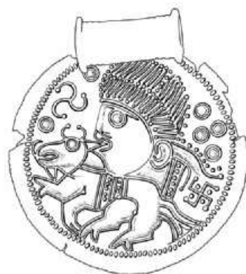
Fig. 3. Motivet på Ericsberg-brakteaten. Tegning H. Lange/P. Wöhliche. —The motif of the Ericsberg bracteate.

vinklerne mellem armene bag det. Hele billedfeltet er omgivet af en perlerække der er fremstillet i samme arbejdsgang som billedmotivet, og brakteaten blev til sidst indrammet med en perlet randtråd og forsynet med en bæresøskne med tilsvarende guldtråde på enderne. Både randtråden og trådene på søsknen er stærkt slidte. Desuden mangler dele af randtråden, brakteatpladen har været brækket i to stykker, og tilsvarende har søsknen været brækket af sammen med det nærmeste stykke af pladen. Begge dele er ret klodset repareret ved pålodning af smalle metalbånd (kobber?) på bagsiden – en reparation, der ikke kan stamme fra oldtiden. I sin nuværende tilstand måler brakteaten 34 mm i vandret diameter, og den vejer 5,48 g. Søsknen er 15 mm lang.