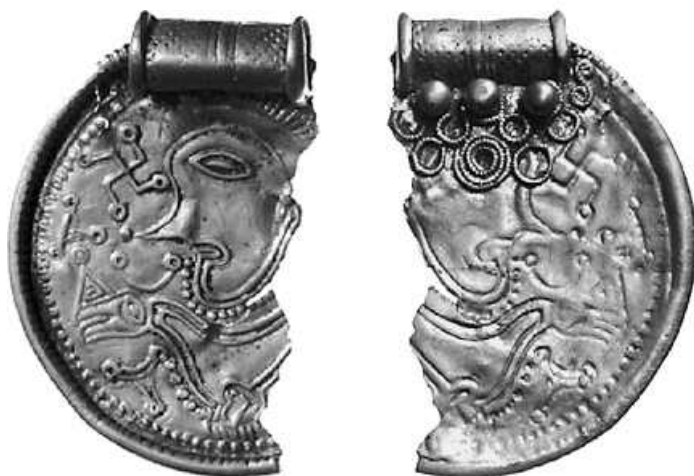
Fig. 5: C-brakteat fra ukendt findested (IK 590), for- og bagside. Højde 29,3 mm, bredde 20,2 mm. —Type C bracteate of unknown provenance, obverse and reverse.

Ericberg-brakteaten er ikke det eneste eksemplar med øsken af den særlige type med glat rør som er kommet frem i lyset i de senere år. De dygtige bornholmske amatørarkæologer har i 2009 fundet to stempelidentiske småbrakteater ved Smørenge (IK 628; Axboe, under udgivelse), der begge har sådanne øskner.