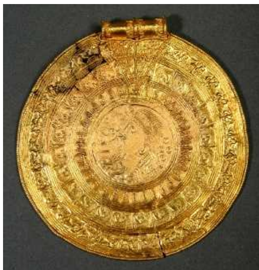
Fig. 4. Stor C-brakteat fra Lyngby i Østjylland (IK 116,1). Diameter 80,5 mm. –Type C bracteate from Lyngby, East Jutland.

Billedet er ikke entydigt, men der er en klar tendens til at brakteater, hvis øsken består af et glat rør med perletråde om enderne og en udsmykning med punselmærker og/eller omløbende furer, er fundet i Syd- eller Midtjylland. Det kan tale for at Ericssberg-brakteaten også stam-